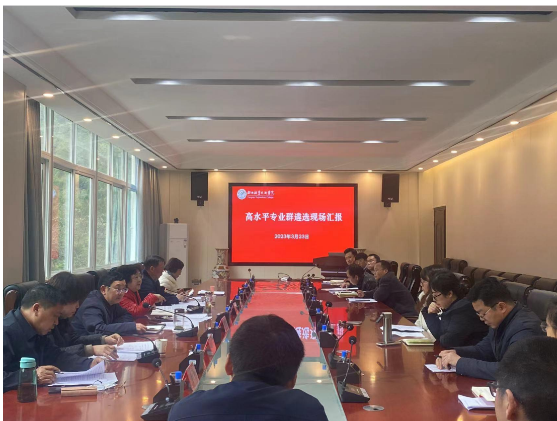
(专家组对三个专业群汇报情况进行点评现场)