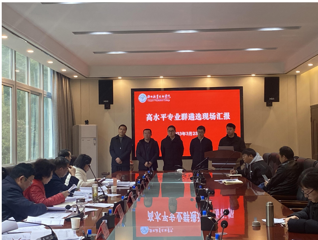
(大数据技术专业群汇报现场)