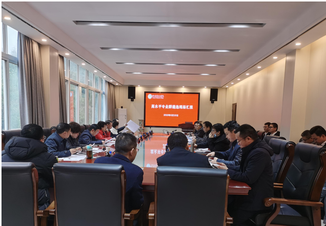
（召开 2023 年高水平专业群遴选汇报会议现场）