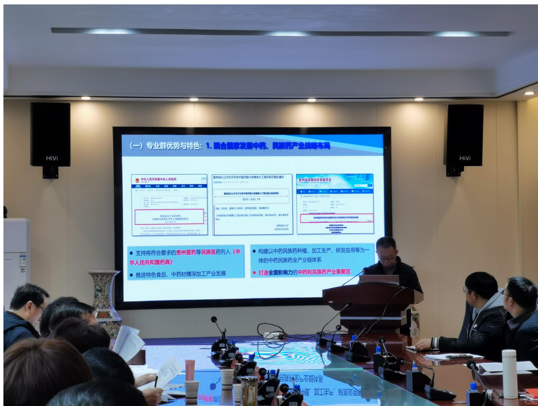
(药品生产技术专业群汇报现场)